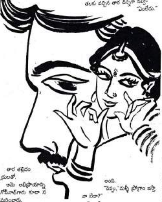
వాళ్ళు కాపురం పెట్టేముందు