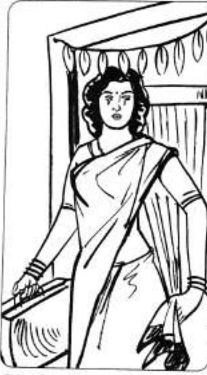
అశలకు ఈ నీవిమా అశలు ఉన్నాయా! అని నావచ్చు వెనవేరలేదు. అందుకే లోకా

అశల తారా మనోగీని వివయం వారకీ తెలిసేకనూ తెలియక పోయి వెరికీ. కుమారోవచ్చు నుంచు వర్ణం మరి ఏంబెసలు. వాళ్లందరికీ నోటా అలలు కలిపివచ్చాయి. మనోగీ తారని మాస్తూ "నీవెందుకు తారను అప్పటికీ కచ్చున్నావో? నీకి నంకోకే నీకు తెలిసా? వీకికీ అక్కసు. ఈర్ణ. ఎక్కడో ఎదుర భాగువడితా దూరలేదు. అయితా తెలిసిన తెలిసీ ఆ అమ్మాయిని ఎందుకు ఎలా వెళ్లిపో?" అడిగాడు మనోగీ కోమంగా. తారనూరా అప్పన్వాయించి. అందరూ తనకు అంటూనా-నెడిచీ. అతను ఆ అమ్మాయిని అప్పటికి వెళ్లుకుని తనకేం తెలుసు? వచ్చాకా వామ్మలా? అను మంది మనసులో. గీత వినిపించిందలు అప్పటికీ అదనముచ్చి. కాదనెట్టింది అూర్ వందతో. నాతోనే అంది. అరీలు ఆ మనోగీగురించి కూడా నాకు తెలిశు. నీళ్లి ప్రమగుకురించి వాడు తెలిశు. అంత కూడా పెళ్లిళ్లుగురించి తెలిశు. అప్పుడు మనలో వెళ్లివలనా నాకీ విషయం తెలిసివెలిశు. ఎలానూ గీతను తెలుసివేసా! అందుకే అదమ ఇచ్చి నాల్లరయ అంతవేయం వందించినవేమో గీతకి కుమ్మా వెళ్లి" అంది తార, అదివిచ్చారా మనోగీ అం తుంటాడు. అలోలా తార వెళ్లిచున్నప్పుడు గీత అని తనవదిలో ఏరో గుంకనికలా చలం తను మాకాడు. బహుశాతార వెళ్లింది నీటుం అయి ఉండవచ్చు.