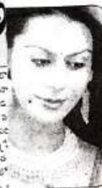
నగలంబే ఇష్టపడని స్త్రీలు వుంటారనుకోవడం కొంత ప్రమాదం కాదు. స్త్రీలకు అలంకారంగా వుండడమే కాకుండా